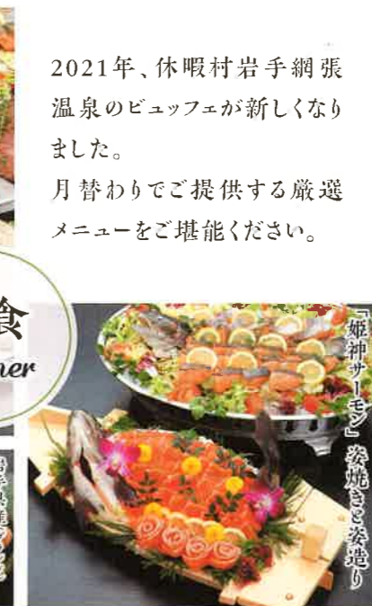
「姫神サーモン」姿焼きと姿造り