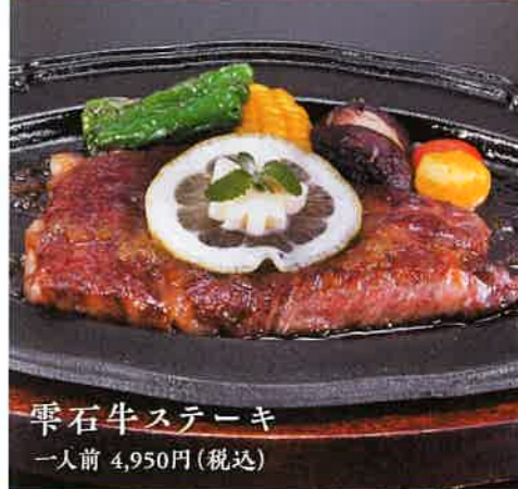
雫石牛ステーキ 一人前 4,950円(税込)