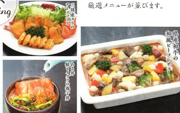
ホットサンド 地鶏の卵サンド 三陸産タラの 卵マッシュ あさ井 銀だまの親子丼 和風ビーフシチュー 和風ビーフシチュー