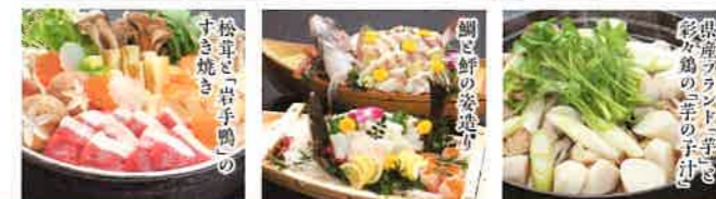
岩手県産アジの きのこの香りの天ぷら アジの刺身 アジの刺身 アジの刺身

夕食は三陸の海鮮に地元のブランド肉、野菜も地元産を多く使用し、和洋取り混ぜて岩手を存分に味わっていただけます。