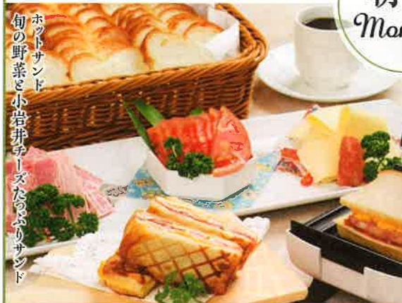
ホットサンド 旬の野菜と小岩井チーズたっぷりサンド