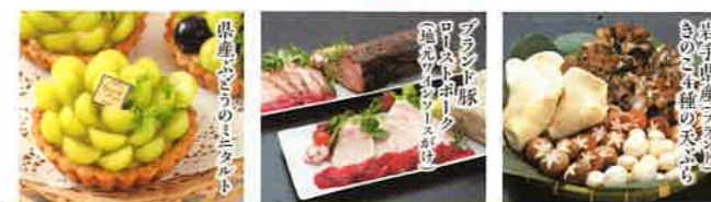
岩手県産アジの きのこの香りの天ぷら アジの刺身 アジの刺身 アジの刺身

2021年、休暇村岩手網張温泉のビュッフェが新しくなりました。 月替わりでご提供する厳選メニューをご堪能ください。