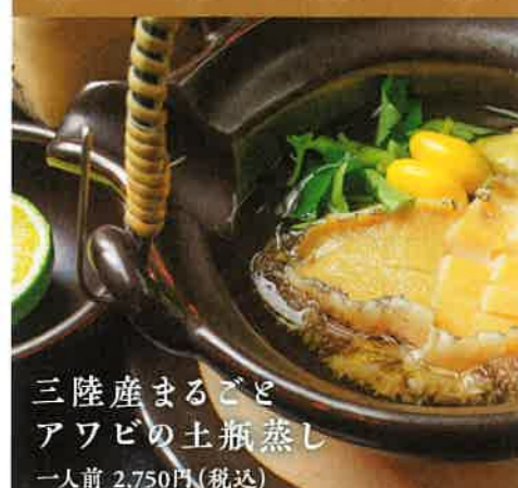
三陸産まるごと アワビの土瓶蒸し 一人前 2,750円(税込)