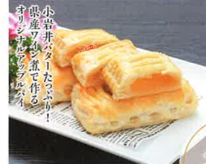
小岩井バターたっぷり！ 県産アジで煮たつぶり！ オリジナルアツパルバイ