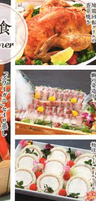
地鶏回転焼りの 香煎焼き 鱈の姿造り 岩手県産アジの きのこの香りの天ぷら アジの刺身 アジの刺身 アジの刺身