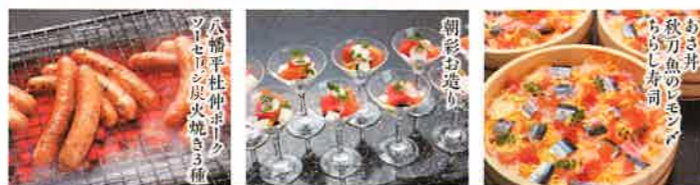
八幡平杜仲まぐろ ワイルドの炭火焼き三種 朝彩お造り あさ井 秋刀魚のレモン ちらし寿司 県産ぶどうのミニトマト 岩手県産アジの きのこの香りの天ぷら アジの刺身 アジの刺身 アジの刺身