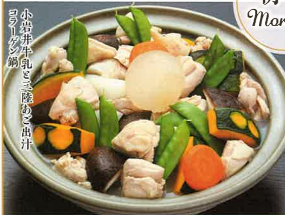
小岩井牛乳と三陸あご出汁 コラーゲン鍋