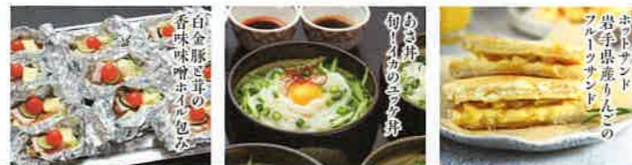
白金豚と茸の 香味味噌ホイル包み あさ井 ゆりかげの巻物 ホットサンド 岩手県産りんごの フルーツサンド